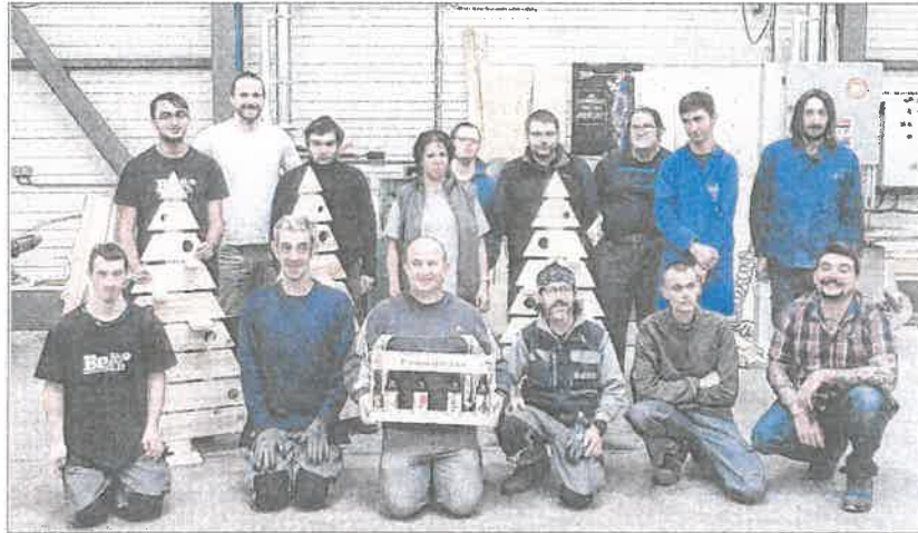
■ L'équipe de l'atelier bois et ses créations.

Ces établissements, plus connus sous leur ancien nom CAT, proposent un service d'aide par le travail médico-social. « L'objectif est de favoriser l'autonomie, l'épanouissement, le développement d'habiletés sociales