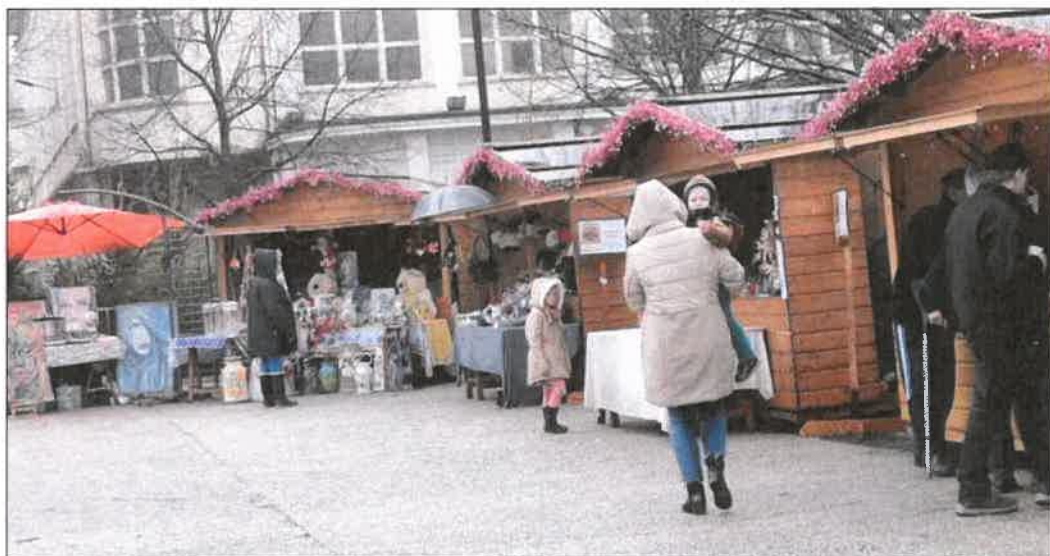
■ Le marché festif se composera de sept chalets et de tentes, utilisées entre autres, par les associations.

L'inauguration de cette nouvelle édition se tiendra vendredi à 17 h 30, suivi du spectacle nocturne Les Astros de la compagnie Elixir, offrant au public un art visuel où des personnages extravagants déambuleront en parade de lumière. Mais avant cela, le clown Tessote, du haut de ses talons ne manquera pas